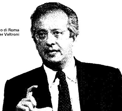
Il sindaco di Roma Walter Veltroni

Esce in libreria "La scoperta dell'alba", romanzo di Walter Veltroni (Rizzoli, 150 pagine, 16 euro). Il libro, che segna l'esordio narrativo del sindaco di Roma, è un viaggio nei sentimenti e anche una dolorosa immersione nella storia degli anni di piombo. Tra attese e speranze di cambiamento. Ne anticipiamo alcuni brani.